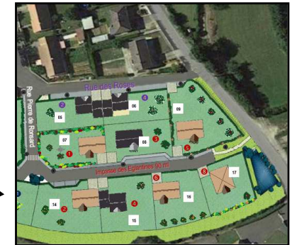
Impasse des Eglantines ►