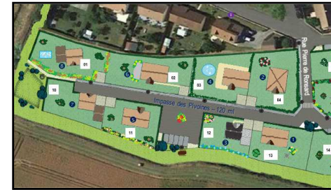
◀ Impasse des Pivoines